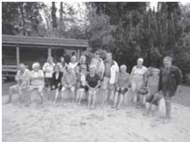
Am 25. Juli 2013 im Jungbornpark an den Tennisplätzen um 17:00 Uhr.

Die Arbeit der Abteilung für Reha-Sport und Freizeitgestaltung richtet sich nicht nur auf die Ausübung sportlicher Übungen, es geht auch um die Gestaltung und Organisation von gemeinsamen Ausflügen, Radwanderungen und sonstigen Gruppenaktivitäten, die Freude und gute Gemeinschaft bringen. Wir treffen uns auch in den Ferien, z. B: