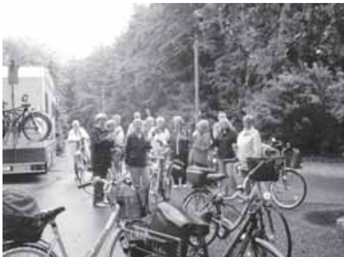
Am 1. August 2013 zu einer Fahrradtour

Wir treffen uns zur Abfahrt um 16:00 Uhr auf dem Parkplatz am Sportplatz. Ziel ist die Alte Mühle in Neukirchen-Vluyn. Die Strecke hin und zurück beträgt 34 km. Pausen und Einker sind möglich. Auch diese Einladung richtet sich an alle interessierten Mitglieder.